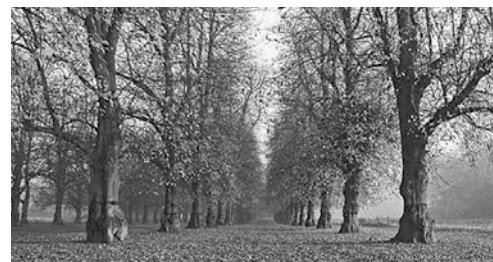
Budova zámeckého sídla v Clumber Parku zanikla ve třicátých letech 20. století, krásný přírodně-krajinářský park je tím pravým místem pro společnou dobrovolnou práci i zábavu pro celé rodiny.