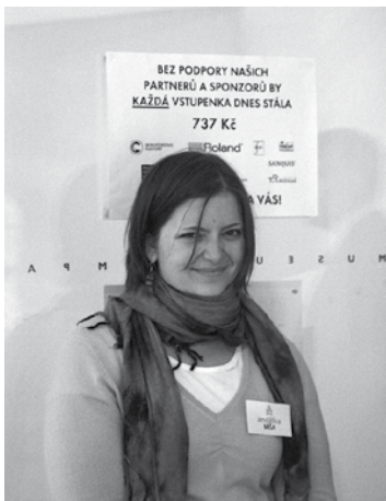
Míša z andělské letky jako uvaděčka na koncertě Orchestru BERG v Museu Kampa.

Všem dobrovolníkům nabízíme jako poděkování vstupenky na naše koncerty. Naše dobrovolnická základna se stále lehce obměňuje v závislosti na možnostech a momentální situaci každého z našich andělů, ale hodně jich s námi zůstává. V poslední době se nám noví dobrovolníci hlásí sami, většinou po návště-