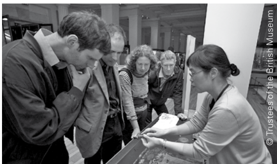
Dobrovolník s návštěvníky u stanoviště programu „Hands-on“ v Britském muzeu

Mnoho dalších dobrovolníků pracuje s veřejností; pomáhají s aktivitami pro dospělé, studenty a rodiny; vedou každodenní prohlídky sbírek nebo jedno ze šesti stanovišť programu „Hands-on“, kde mají návštěvníci výjimečnou