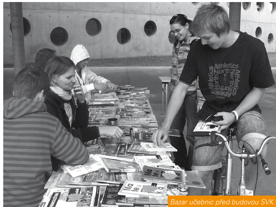
Bazar učebnic před budovou SVK.

Mezi nejúspěšnější patřila akce Kniha – černá pasažérka . Desítky knih obvázaných zlatou stužkou se záložkou naší knihovny našli hradečtí cestující na autobusových zastávkách.