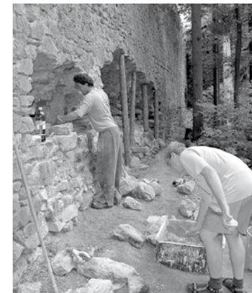
Vyzdívání kaveren v patách zdí bylo předmětem workshopu na hradě Lietava (okres Žilina) ve dnech (23.–26. 7. 2005).

Zkušenosti s pořádáním těchto aktivit mohou být dobrou pomocí pro mnohé vlastníky památek, které jsou nejen ve správě státu, ale i obcí nebo soukromníků.