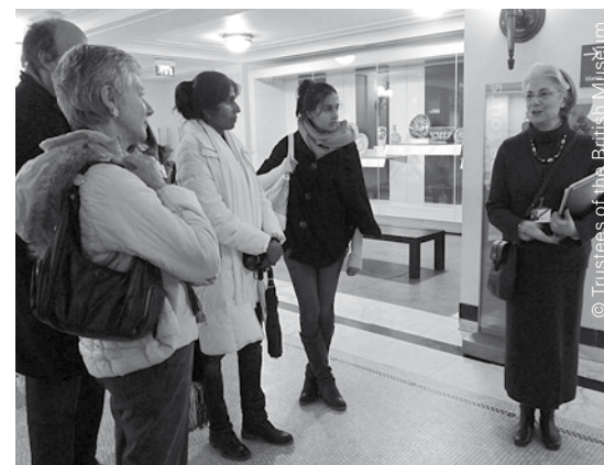
Dobrovolník, který vede prohlídky „eye-opener“ v Britském muzeu.

Mnoho dalších dobrovolníků vede jedno ze šesti stanovišť programu „Hands-on“, kde mají návštěvníci výjimečnou příležitost dotknout se sbírkových předmětů.