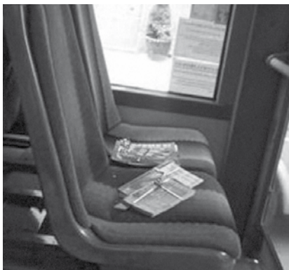
Balíčky knih z akce Kniha – černá pasažérka pár minut před rozebráním.

byl dílem ochotných knihovnic. I když v tomto případě byly profesionálky knihovnice rovněž dobrovolnicemi.