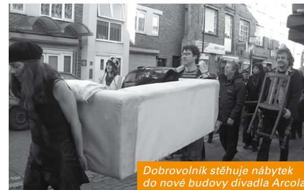
Dobrovolník stěhuje nábytek do nové budovy divadla Arcola

V roce 2010 se divadlo Arcola se svou veškerou činností přestěhovalo do nového objektu v ulici Ashwin. Dobrovolníci se podíleli na všech etapách přesunu. Při rekonstrukci budovy z továrny na barvy na divadlo se čtyřmi scénami se podílelo přes tisíc dobrovolníků. Týmy ze soukromých firem bouraly zdi, malovaly stropy, vysypávaly podlahy pískem a zasklívaly okna.