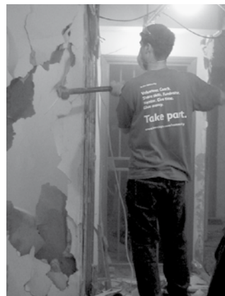
Dobrovolník z banky Barclays bourá zeď Studia 1

dobrovolníky ve Front of House, aby návštěvníkům říkali, že zde pracují právě jako dobrovolníci. Ze zkušenosti víme, že se postoj návštěvníků promění, když se dozví, že osoba,