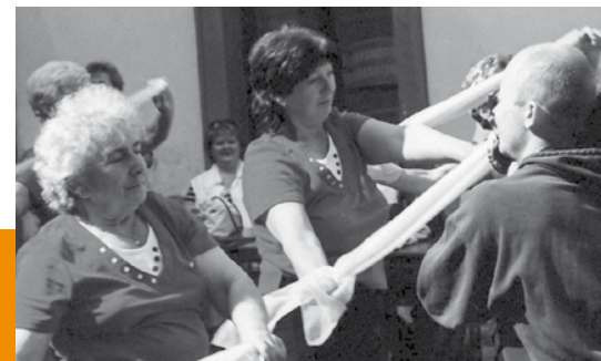
Den D – Den s dechovkou nejen pro seniory na zámku Jezeří spoluorganizují i členové Klubu seniorů z Horního Jiřetína.

Práce dobrovolníků je koordinována vedením správy zámku, je zaměřena zejména na hrábání a odvoz listí, údržbové práce v parku, likvidace náletů a invazivních rostlin, výsadbu a pěstování letniček. Senioři se zde setkávají s mladšími dobrovolníky, vzájemná komunikace a společné občerstvení patří k programu dní. Kastelánka zámku vysoce hodnotí velkou pracovitost dobrovolníků z řad seniorů, jichž se do jednotlivých akcí zapojuje několik desítek již více než čtyři roky.